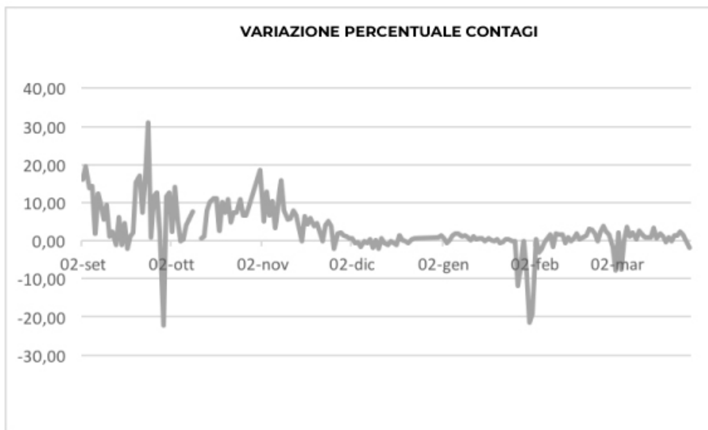
VARIAZIONE PERCENTUALE CONTAGI