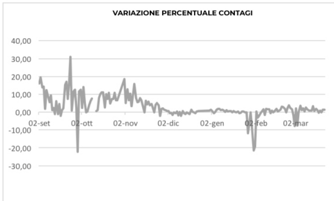
GRAFICO VARIAZIONE PERCENTUALE CONTAGI