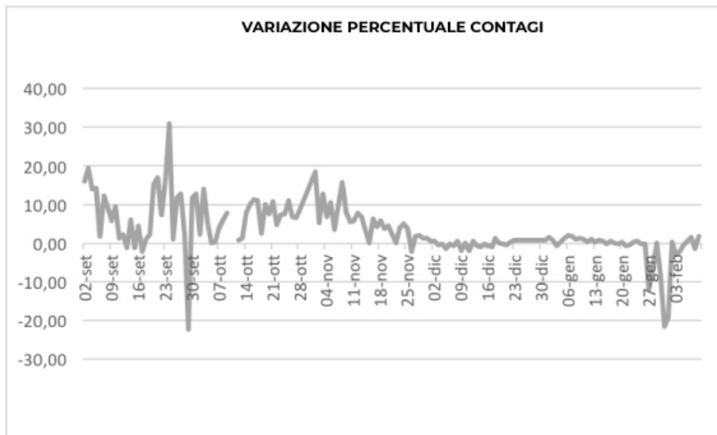
VARIAZIONE PERCENTUALE CONTAGI