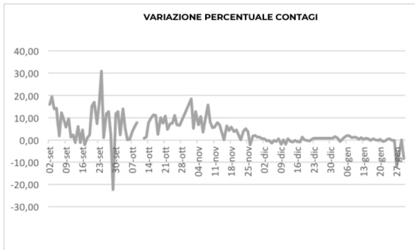
GRAFICO VARIATIONE PERCENTUALE CONTAGI