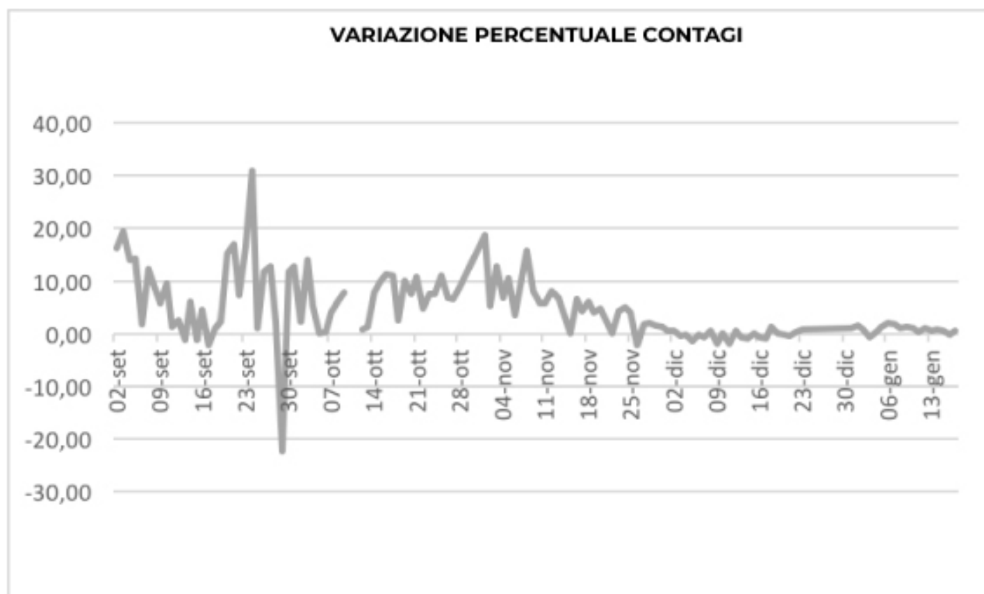
GRAFICO VARIATIONE PERCENTUALE CONTAGI