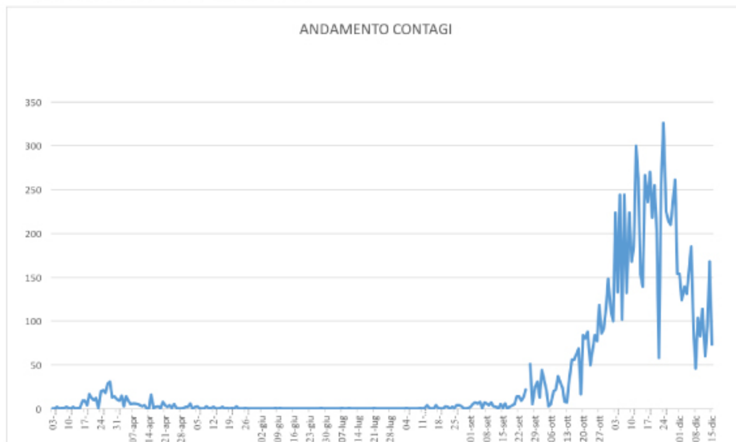
GRAFICO ANDAMENTO CONTAGI