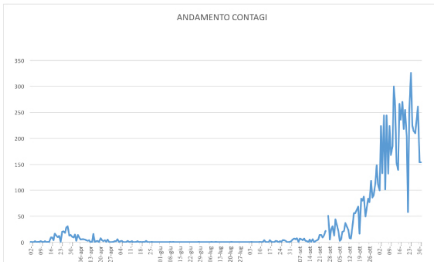
GRAFICO ANDAMENTO CONTAGI