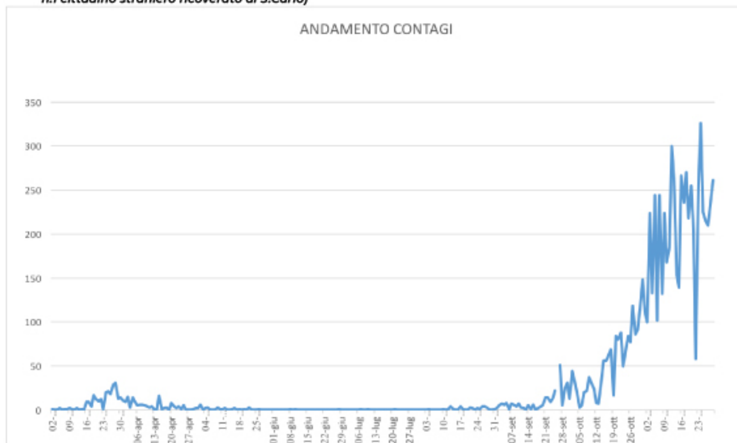
GRAFICO ANDAMENTO CONTAGI