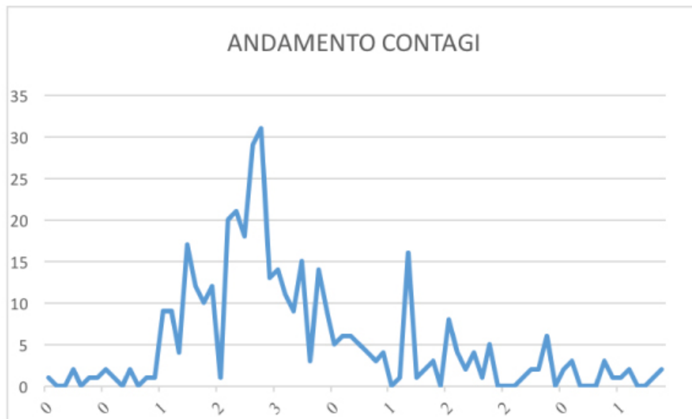
GRAFICO ANDAMENTO CONTAGI